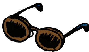
b. Des lunettes de soleil