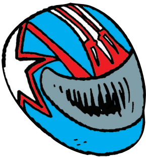
a. Un casque