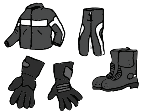
c. Des vêtements couvrants